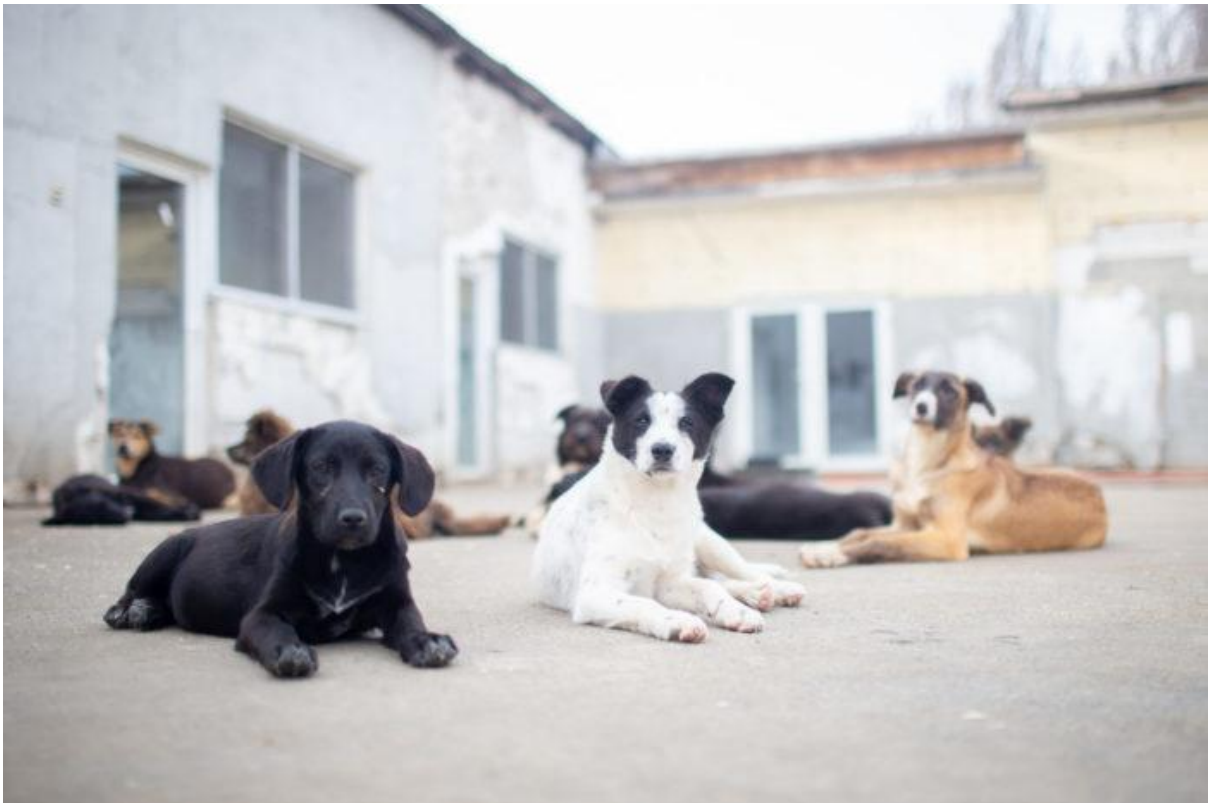
Yhteistyötarhallemme Cosobaan hylätään koiria ja pentuja jatkuvasti.

Toukokuussa aloitimme Steriloinnit Giurgiussa -projektin , alueena tarkemmin piirikunnan pohjois-osa jossa myös isoin adoptioyhteistyötahomme tarha One Rescue Association sijaitsee. Projektin tarkoitus on auttaa vähentämään tarhalle hylättävien koirien määrää pidemmällä ajanjaksolla sekä parantaa eläinten oloja kyseisessä piirikunnassa.