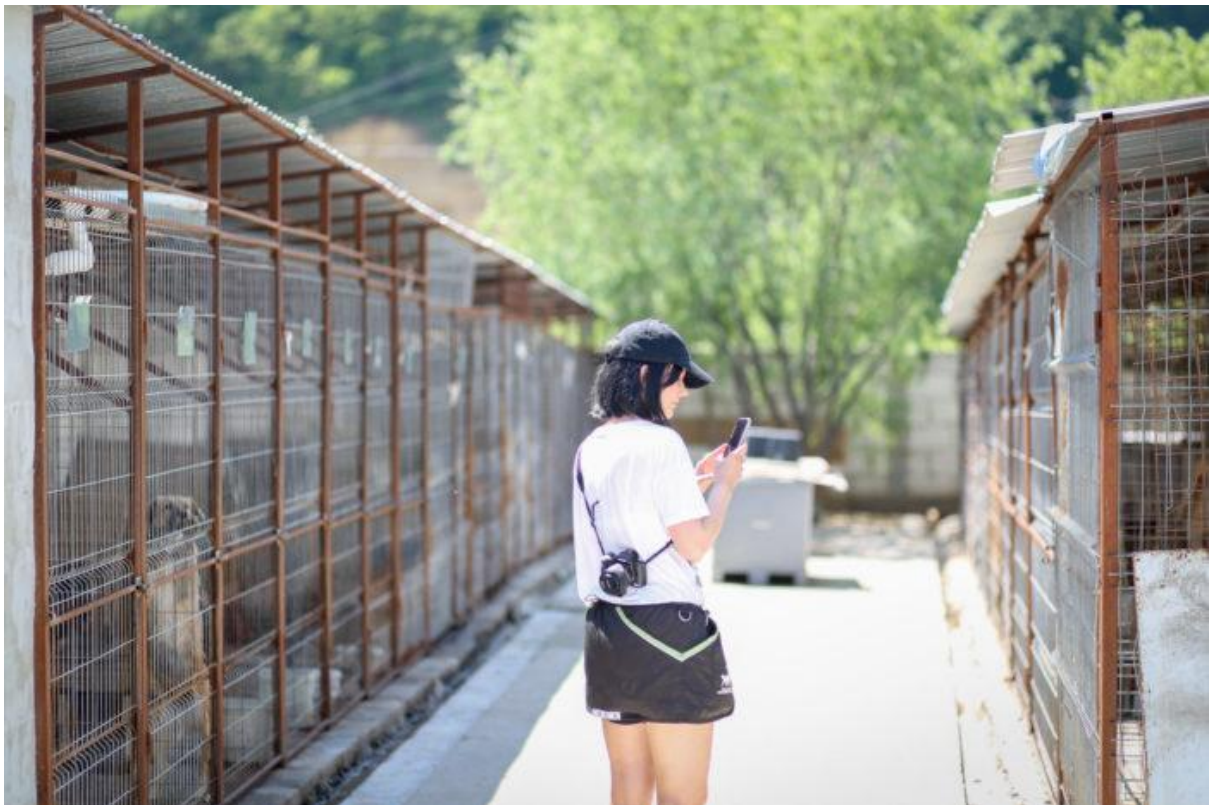
Toimikauden lopussa Kulkureissa toimi 61 aktiivia.

Yhdistyksessä toimii toiminnanjohtajan lisäksi kaksi osa-aikaista toimihenkilöä – varainkeruukoordinaattori sekä kuormalogistiikan vastuhenkilö. Nämä toimenkuvat jakautuvat turvaamaan yhdistyksen taloudellista vakautta hallinnollisesti ja operatiivista toimintaa kriittisillä toiminnan osa-alueilla, vankentaen näin toiminnan kivijalkaa oleellisesti. Kaikkien toimihenkilöiden toimenkuvat on jaettu siten, että yhdistyksen kriittisimmät toiminnot on turvattu osaavien ja motivoituneiden työntekijöiden toiminnalla. Palkatun henkilökunnan avulla yhdistys pystyy kehittämään toimintaansa pitkällä tähtäimellä ja vastuullisesti sekä hallinnoimaan paremmin toimintaan kohdistuvia riskejä ja varmistamaan toiminnan jatkuvuuden.