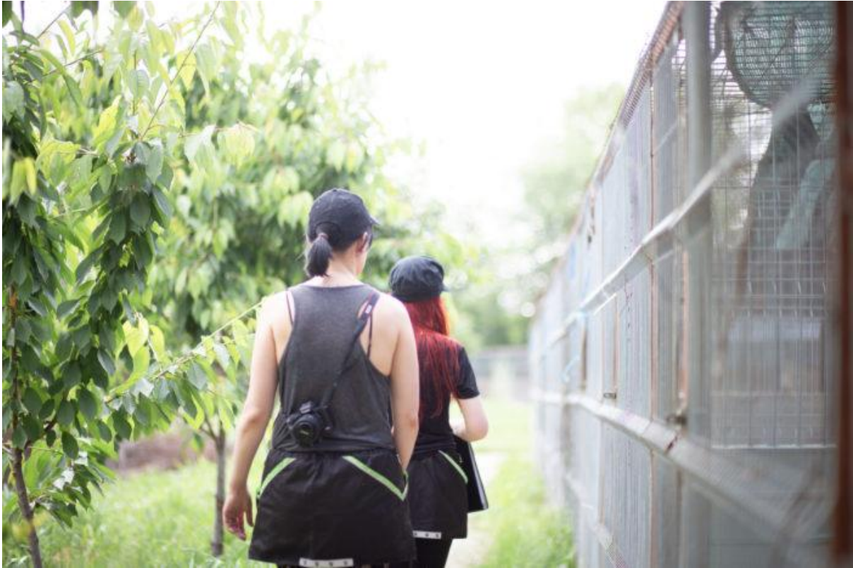
Saimme useita uusia vapaaehtoistoimijoita vuonna 2022.

tieto-taitoan rescuekoiiriin liittyen etukäteen ja itsenäisesti. Tavoitteena oli julkaista rescueajokortti vuoden 2023 alussa yhdistyksen kotisivuilla ja sosiaalisessa mediassa. Rescuekoiira-ajokortin tarkoituksena on toimia myös uutena työkaluna adoptioyhteyshenkilöillemme ja helpottaa täten uusien adoptioiperheiden kartoittamista.