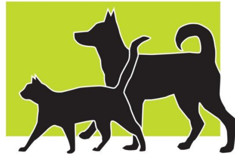
Rescueyhdistys Kulkurit Rescue Association Hobo Dogs

Rescueyhdistys Kulkurit ry on eläinsuojelun parissa toimiva aatteellinen ja yleishyödyllinen yhdistys. Yhdistys on perustettu vuonna 2012 ja se toimii kestävän eläinsuojelutyön periaatteiden mukaisesti. Yhdistyksen tavoitteena on eläinten kokonaisvaltaisen hyvinvoinnin edistäminen ja kodittomien eläinten määrän vähentäminen kestävän kehityksen keinoin. Yhdistyksen toimihenkilöt pyrkivät toiminnan kehittämiseen, läpinäkyvyyteen ja aktiiviseen tiedottamiseen sen toiminnasta tukijoitaan kunnioittaen.