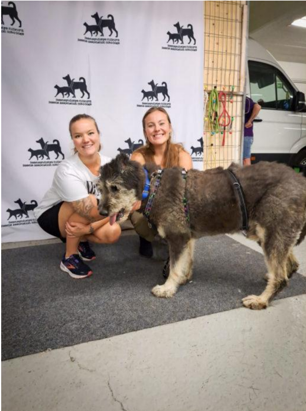
Naava saapui kotiin Suomeen 13.8.2022.

Toimintakauden 2022 tarkasteltiin jatkuvasti ja aktiivisesti adoptiotoiminnan kustannusrakennetta. Syksyllä yhdistyksen hallitus päätti nostaa koirien kulukorvauksia adoptiotoiminnan kohonneiden kulujen kattamiseksi. Kustannukset Romaniassa nousivat Venäjän hyökkäyssodan vaikutusten myötä ja tämä aiheutti muutoksia yhdistyksen adoptiotoiminnan kulurakenteeseen. Lisäksi lisääntyneiden sydänmato-positiivisten koirien määrän vuoksi yhdistys uudisti adoptioprosessia niin, että jatkossa adoptioperheiden tulee osallistua kotiin varatun koiran sydänmatohoitoon minimikustannuksella. Uudella mallilla sydänmatohoidot eivät jatkossa jää kokonaisuudessaan yhdistyksen kustannettaviksi ja kuormita