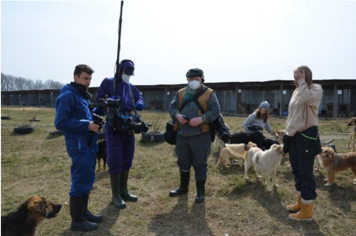
Kuvausmatkalla Ylen kanssa maaliskuussa 2022.