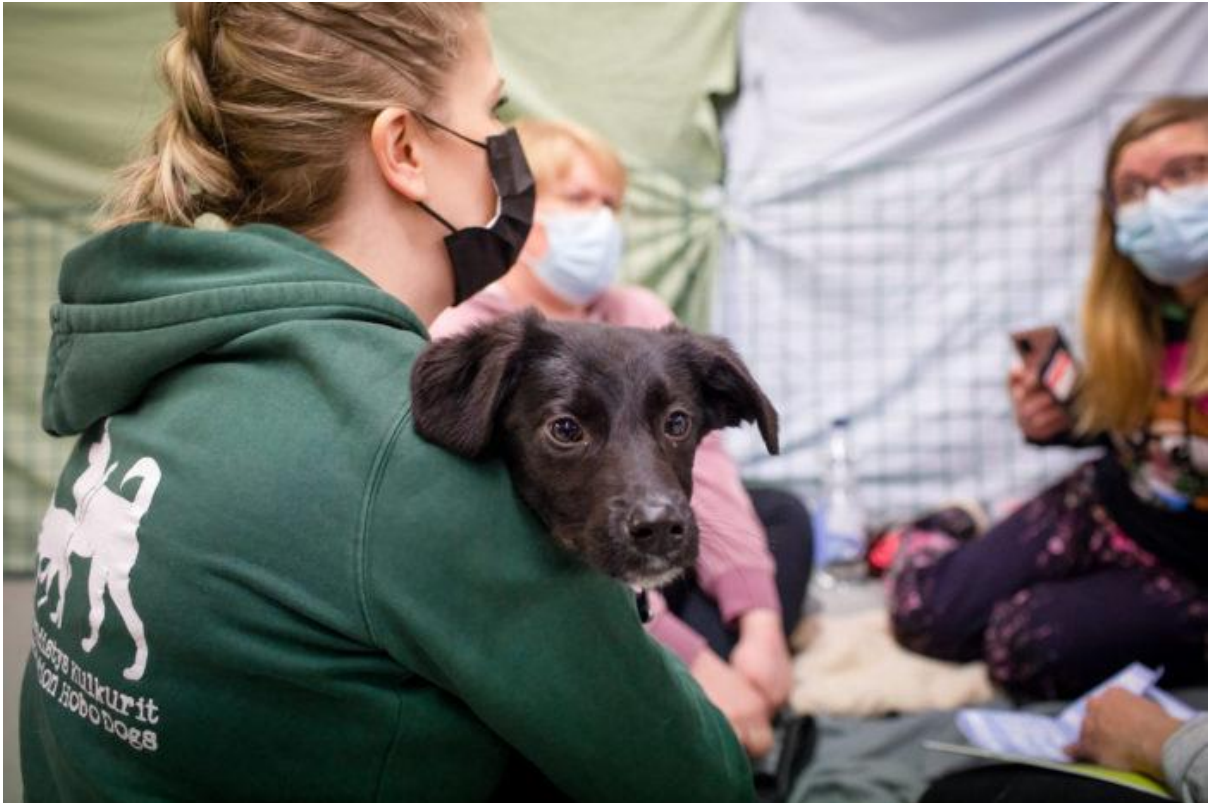
Mukana toiminnassa oli myös useita muita henkilöitä auttamassa mm. koirien luovutuksissa.