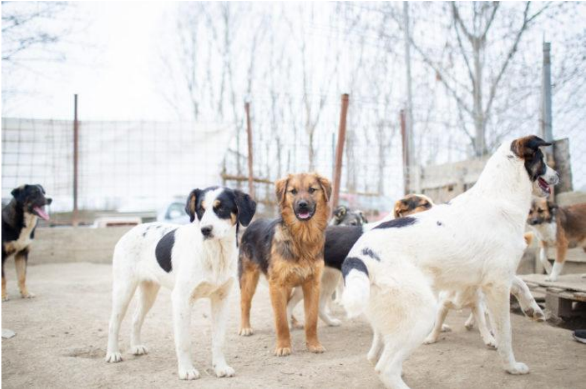
Carpen tarha maaliskuussa 2022.

Vuoden aikana kehitimme monia sisäisiä toimintojamme ja kehitimme myös uusia tapoja toimia. Jatkoimme säännöllisesti edellisenä toimintavuotena aloitettuja sisäisiä yhteyshenkilöiden palavereja, joissa käsitellään kulloinkin käynnissä olevia ajankohtaisia asioita. Näissä kokouksissa käsittelemme adoptioprosessia, sen mahdollisia kehityskohteita ja haasteita sekä erilaisia yhteyshenkilöiden kokemuksia ja tunteita. Keskustelut ja kokoukset tarjoavat paitsi alustan ideoinnille ja kehittämiselle myös pitävät yhteyshenkilöt ja yhdistyksen toimijat ajan tasalla adoptiotoiminnasta ja mahdollisista muutoksista. Ne myös tarjoavat yhdistyksen toimijoille tärkeää vertaistukea sekä mahdollisuuden jakaa ajatuksia ja tunteita muiden kanssa ja saada ideoita ja ratkaisuja haasteellisinkin tilanteisiin.