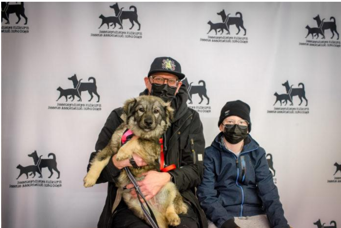
Suloinen Eleonoora (nyk. Padmé) saapui oman perheensä luokse 19.3.2022.

Responsible Rescue-sitoumuksen kriteeristön mukaisesti yhdistys toteutti rabies vasta-aineiden seulontoja myös kertomusvuonna, yhteensä 24 koirasta, joista 11:llä vasta-aineet eivät nousseet ensimmäisellä testauskerralla riittävästi. Tähän liittyen jatkoimme vasta-aineiden nousemattomuuden selvittelyä suomalaisten ja romanialaisten ammattilaisten kuten eläinlääkärien kanssa. Selvitystyö ja seulonnat jatkuvat myös jatkossa normaalisti.