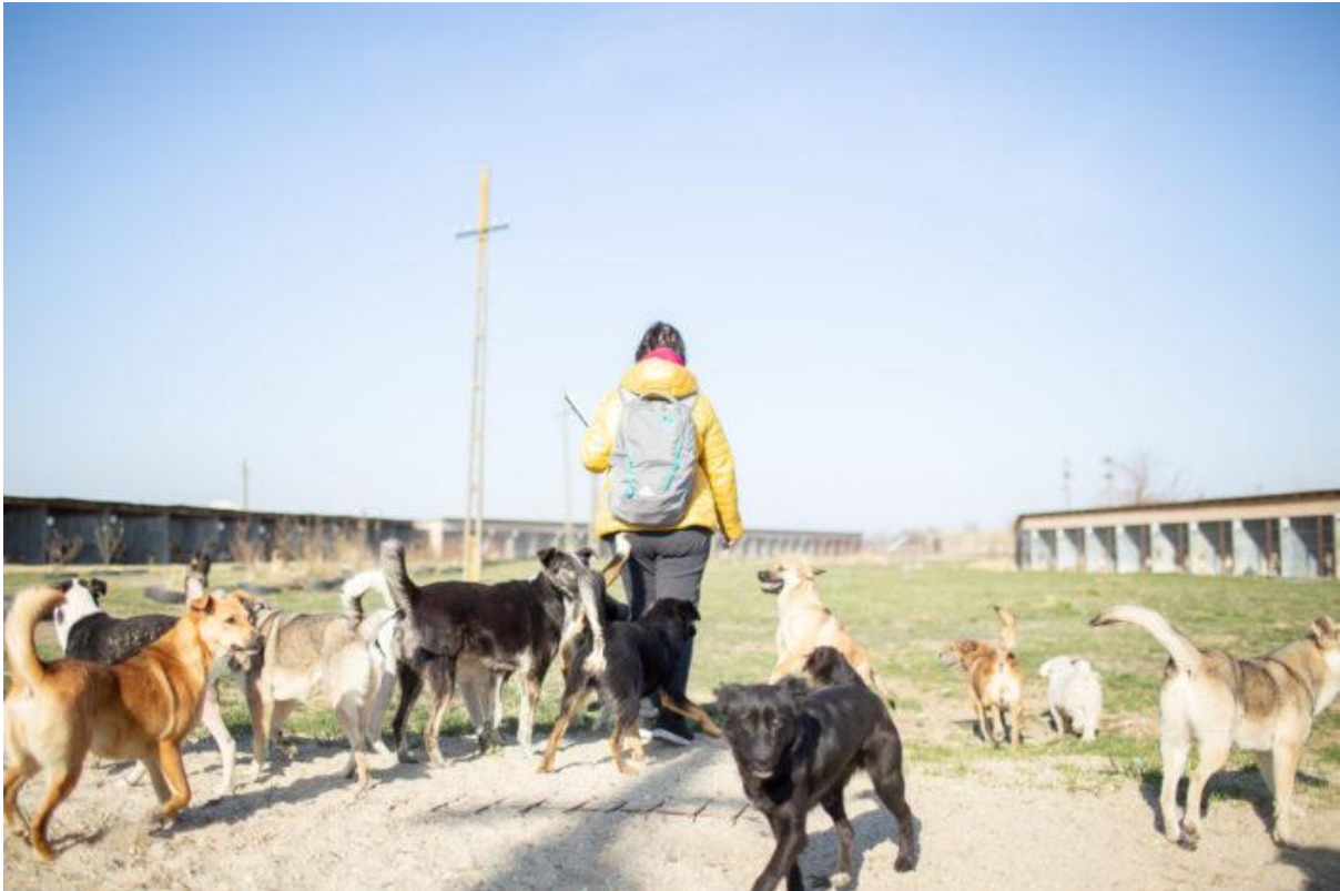
Vierailulla yhteistyötarhallamme Romanian Cosobassa maaliskuussa 2022.

Kulkureissa oli aktiivisia toimihenkilöitä kuluneena vuonna keskimäärin 61 (54). Tarvittaessa yhdistys on hakenut, ja poikkeuksetta löytänyt, avoimen rekrytoinnin kautta uusia vapaaehtoisesti toimivia toimihenkilöitä riveihinsä. Aktiiviset toimihenkilöt tekevät yhdistyksen hyväksi vapaaehtoista, palkatonta, työtä omalla vapaa-ajallaan. He mahdollistavat yhdistyksen jatkuvan toiminnan ja kehityksen jokapäiväisellä työllään. Lisäksi yhdistyksessä toimii kolme osa-aikaista, työhönsä sitoutunutta ja ammattitaitoista palkattua työntekijää eri tehtävissä. Vaikka yhdistyksen toiminta nojaa vahvasti vapaaehtoistyöhön, haluamme vahvistaa ja vakiinnuttaa osaamispohjaa palkattujen työntekijöiden muodossa myös tulevaisuudessa yhdistyksen taloudellisen tilanteen niin salliessa.