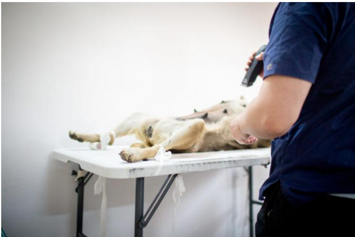
Paws Care Vetin sterilointipäivä Fetestissä maaliskussa 2022.